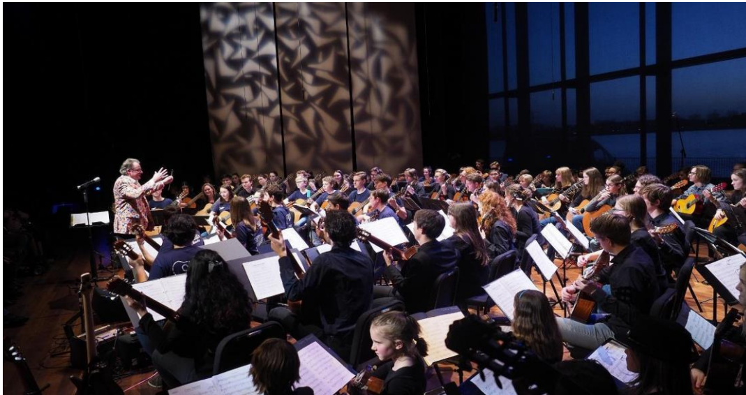
Concert 'Guitar Rhapsody', KAF op 19 januari 2020

Dit verslag over 2020 beschrijft de activiteiten van onder meer gitaarorkest Ponticello, gitaarorkest De Ontdekking, het NJGO en gitaarorkest Guitarrísimo.