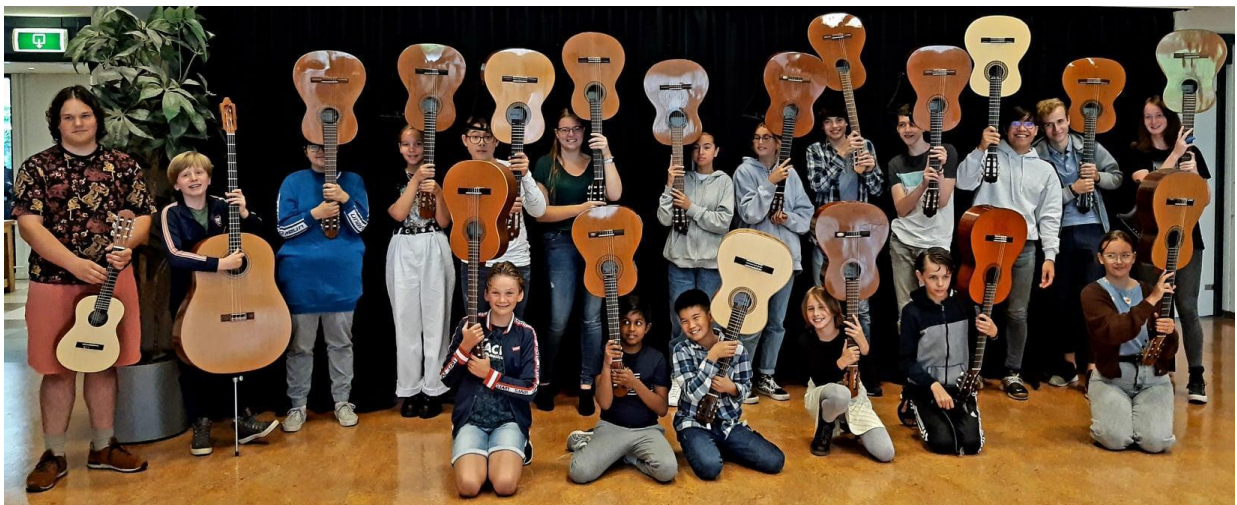
Gitaarorkest Ponticello repetitie, september 2020

Inkomsten uit donaties laten een bescheiden toename zien en de stichting is dankbaar voor deze trouwe donateurs. Deelnemersaantallen zijn redelijk stabiel gebleven, en daarmee ook de inkomsten uit de deelnemersbijdragen. Wel betekende het gebrek aan concerten, projecten en festivals een beperking in de zichtbaarheid, waardoor het lastiger is gebleken om het aantal nieuwe deelnemers aan te trekken dat we op het oog hadden.