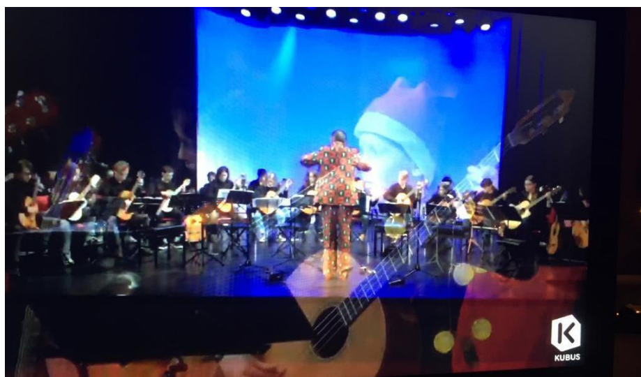
Livestreamconcert Ponticello in De Kubus Lelystad op 12 december 2020

Kijk voor een gedetailleerde beschrijving van alle activiteiten in het overzicht onderaan dit document.