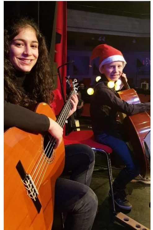
Livestream concert Ponticello. Kubus Lelystad dec 2020