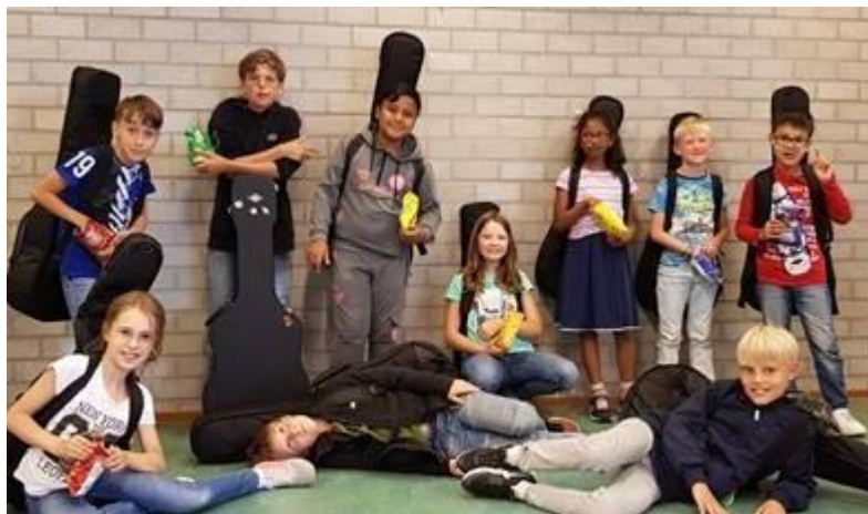
Pilot Junior Gitaarensemble / Gitaarorkest 'de Ontdekking' okt-dec 2020